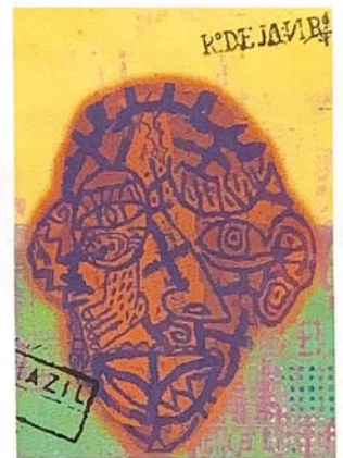
Le rageur, 2007 acrylique sur toile, 130 x 195cm

Ouverture au public : du mardi 05 au vendredi 14 décembre