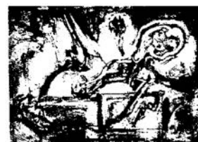
Sortilège. 1967 huile sur toile 134 x 195cm.