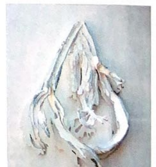
Sculpture composée à partir de bois morts