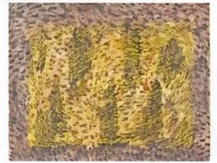
Prainha, 2005 mine de plomb en poudre, bâton à l'huile sur papier japonais marouffé sur toile, 73 x 92cm