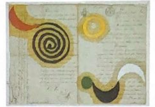
Composição da violeta a., 2006 collage et huile sur document notarial, 30 x 42cm