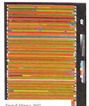
Tissu d'Afrique, 2007 huile sur toile 162 x 114cm

Ouverture au public : du mercredi 19 décembre au vendredi 25 janvier