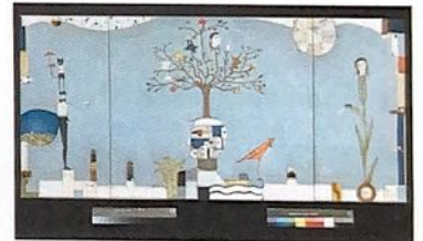
Plein la tête, 2002 tryptique, collage et huile sur toile, 170 x 80cm