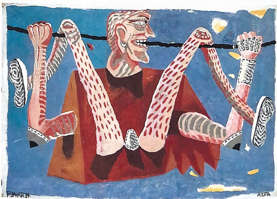
731 L'Acrobate , 1983 técnica mista s/tela 100x150