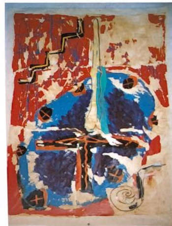
Technique mixte sur toile 130 X 97 cm " CHAKRA "