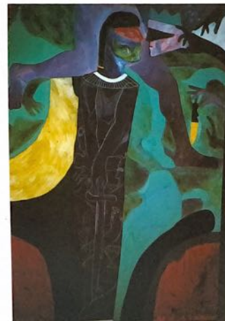
L'huile sur toile 200 X 50 cm " PAJANO " Face à Face 1989