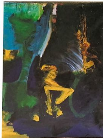
Acrylique sur toile, sans titre, 146 X 160 cm