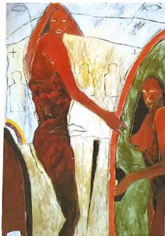
L'huile sur toile 200 X 140 cm " TORO " La maison du verseau