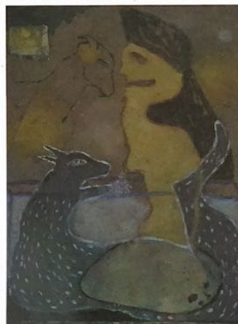
huile sur toile 54 X 65 cm " La Chèvre " 1990